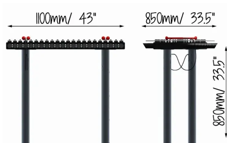
Rys. 1. Wymiary urządzenia