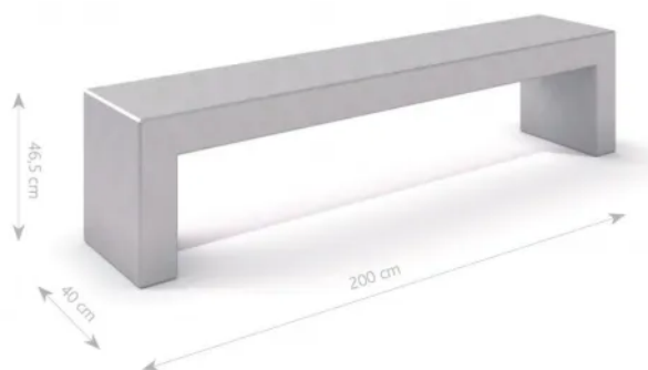
Rys. 1. Wymiary urządzenia