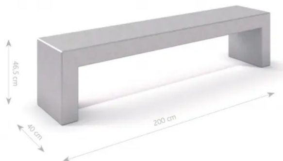
Rys. 1. Wymiary urządzenia