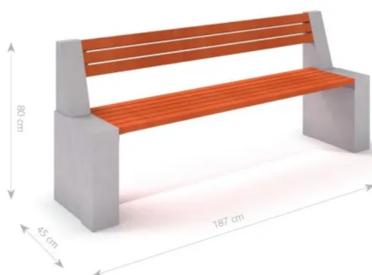
Rys. 1. Wymiary urządzenia