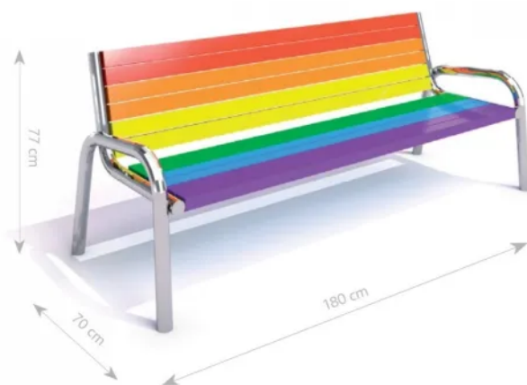
Rys. 1. Wymiary urządzenia