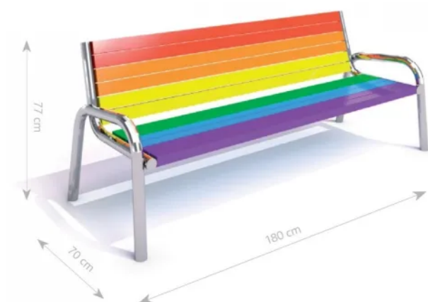
Rys. 1. Wymiary urządzenia