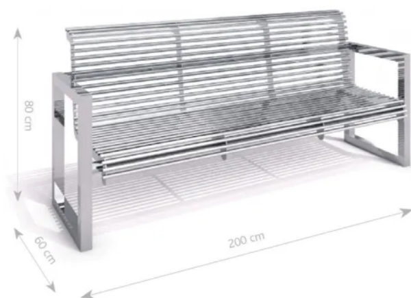
Rys. 1. Wymiary urządzenia