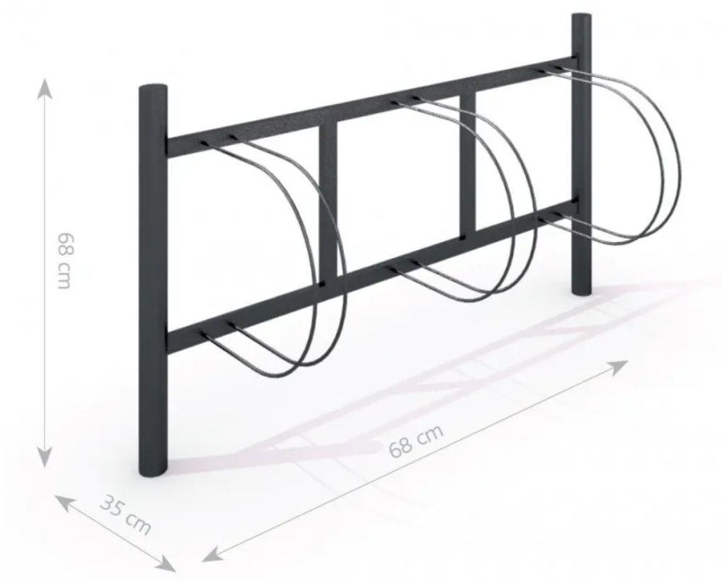
Rys. 1. Wymiary urządzenia