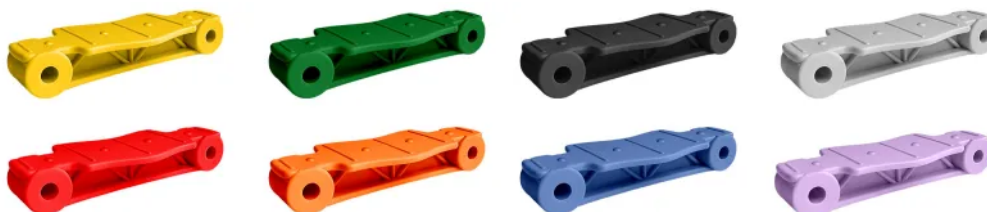
Rys. 3. Dostępna kolorystyka lamelek

Profilowany szkielet w kształcie kratownicy, mocny jak konstrukcja mostu. Podnosi wytrzymałość lamelek na złamanie.