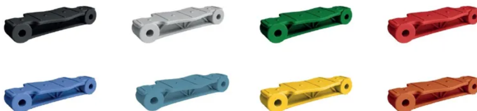
Rys. 3. Dostępna kolorystyka lamelek

Profilowany szkielet w kształcie kratownicy, mocny jak konstrukcja mostu. Podnosi wytrzymałość lamelek na złamanie.