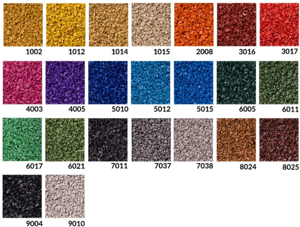
Rys. 5. Dostępna kolorystyka osłony trampoliny - SBR