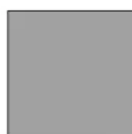
srebrny RAL 9006