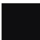
czarny RAL 9005