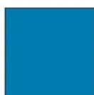
niebieski RAL 5015