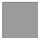
ciemny szary RAL 7004