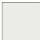
biały RAL 9003