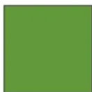
zielony RAL 6018