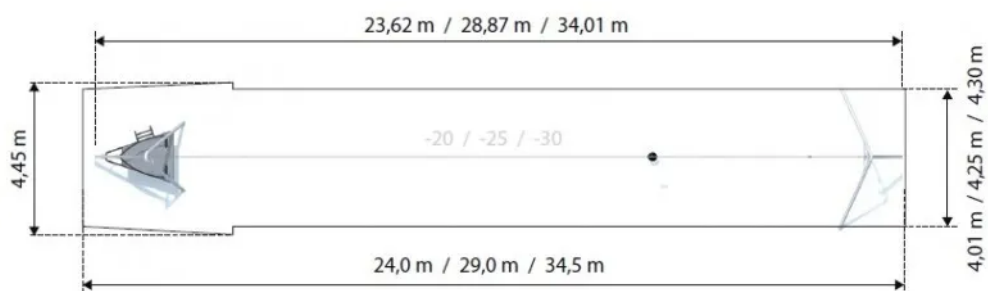
Rys. 1. Wymiary urządzenia i strefy bezpieczeństwa